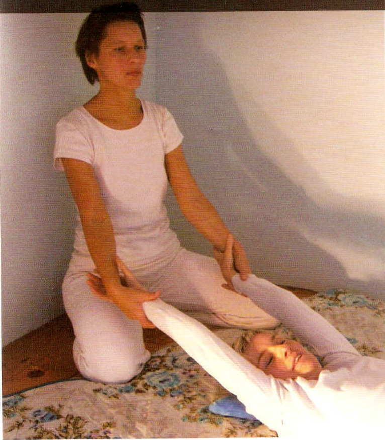
De Shiatsu-massage is slechts één van de vele behandelingen uit het verre oosten.